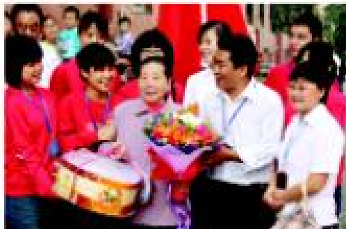
卓达物业特意为老人送去生日蛋糕,生活给予关爱,生活给予幸福,生活给予快乐,生活给予希望。

卓达物业服务总公司,是首家一级物业服务单位,是中国物业管理协会常务理事单位。伴随卓达集团快速发展,公司在全国迅速扩大品牌影响,旗下北京、天津、威海、三亚、五台山、石家庄六家分公司,现管理自有物业总面积达2000万平方米;2013年在开团物业管理协会公布的全国物业管理企业中,位居河北省第1名,综合实力全国位列第13名。