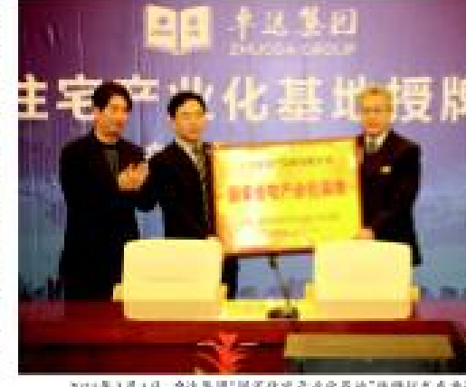
2014年3月4日,卓达集团“国家住宅产业化基地”授牌仪式在卓达大阳城隆重举行。

三产建设,一幢项目计划于今年3月开工了,年底即可实现投产,二期将于今年年底开工;最多18个月的时间即可实现产区的整体建设。卓达集团投产,将实现年产量2000万块相当于4000亩的绿色建筑,加上关联产业产值将达400亿元,实现税收60个亿的总体目标。 2014年1月29日,卓达集团与河北省廊坊永清县政府签署战略合作协议,政企携手,共同建设永清卓达绿色建材高科技产业园区,联手打造河北省新型城镇化示范工程。该产业园项目全部建成后将实现年产值约75亿元,含当地就业约4万人就业。 2014年4月26日,位于石家庄装备制造基地的卓达新型材料产业园正式动工。这是继大阳城之后,卓达集团在河北省各地倾力打造的绿色产业,旨在促进河北省产业升级,按照计划于2015年5月随河北省启动为省重点项目。卓达新材料产业园一期工厂占地500亩,预计自开工之日起18个月内建成投产,产值100亿元人民币,年缴税收10亿元,创造就业岗位1万-2万个。 除此之外,张家口、衡水等地的卓达新材料科技产业园也即将开工建设,卓达新型材料科技产业园将带动河北绿色工业的崛起。 厂区的合作意向已经达成,新材料生产业态不同传统的脚步蓄势待发,建材生产是一个传统行业转型升级的契机,绿色建筑产业将以前所未有的步伐迈进,卓达集团整合新生产力,创新新材料产业新模式,带动河北绿色崛起,打造京津冀一体化进程。(文/刘如军、张世强、张世强)