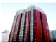
卓达物业服务的书香苑小区