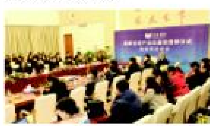
2014年3月4日,卓达集团新任总经理、河北省建设厅石家庄市委副书长的领导,“国家住宅产业化基地”授牌仪式在卓达大阳城隆重举行。河北卓达集团加快在河北省各地建设新型材料产业园,助力河北住宅产业化。