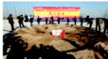
2013年11月29日,河北省石家庄新型材料科技产业园暨生产新城项目启动仪式举行。仪式上,邯郸市委书记高志平宣布启动项目,卓达集团将联合河北省多家知名新材料科技产业园暨生产新城项目启动。