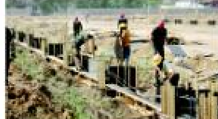
2014年4月26日,位于石家庄装备制造基地的卓达新型材料产业园正式动工。卓达新材料产业园一期工厂占地500亩,预计自开工之日起18个月内建成投产。