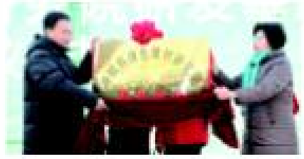
2014年1月29日上午,“中国绿色建筑科技研究基地”正式在位于河北省廊坊永清经济开发区的河北卓达新材料产业园揭牌成立,“这是河北的大事,喜事,大事!”揭牌仪式上河北省政府党组书记高志平再次强调“卓达绿色建材绿色新型产业,是绿色建材新型城镇化建设进程,是绿色建材与绿色城市地建设中国绿色建筑发展理念高度契合,无疑具有重大的社会和经济意义。”