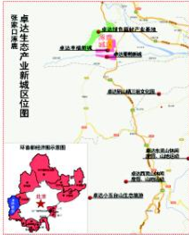
项目基于卓达“三产联动”战略规划,以涿鹿县为中心向西辐射,分为卓达绿色建材产业基地、“两两城”新城镇、生态旅游休闲基地三大板块。