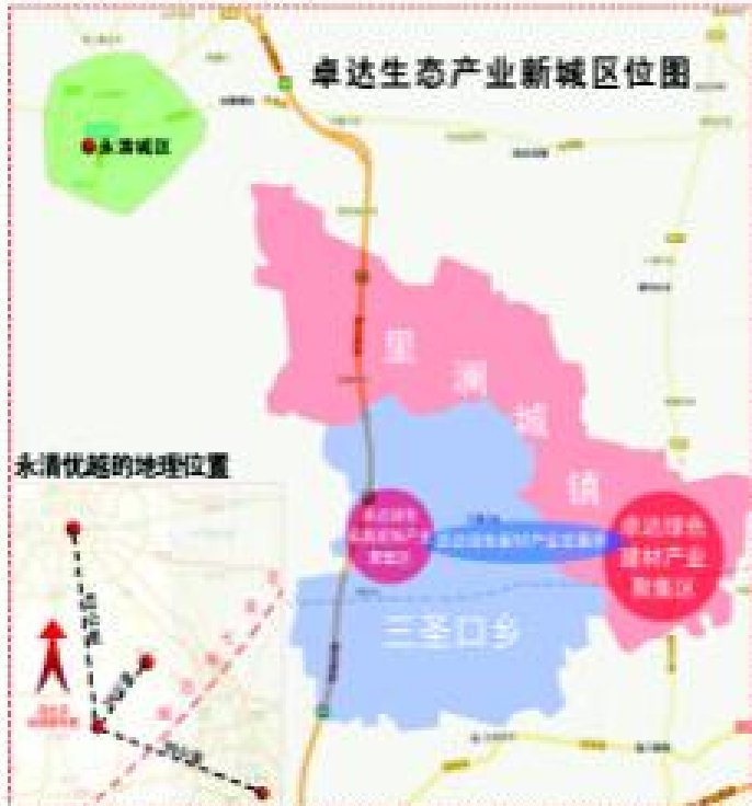
永清生态高科技产业基地项目从京津冀协同发展的绿色建材产业基地,打造三圣口乡,形成“两区一带”战略布局,打造环北京新型城镇化典范之作,对京津冀经济一体化发展起到至关重要的战略意义。

项目总开发规模 123 平方公里,将通过卓达特色的“三产联动”操作模式,结合当地区域优势,形成“两区一带”战略布局。以“集约、智能、绿色、低碳”理念,十年建成国家级绿色城镇高科技示范区。