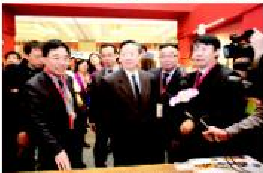
2014年3月28日,“第十届中国国际绿色建筑与建材博览会暨技术与产品博览会”在北京国际会议中心隆重开幕。开幕式后,住建部副部长张毅及相关领导参观了卓达新材料的展厅。他对卓达集团成为国家绿色建筑建材龙头企业表示肯定,并详细询问了卓达新材料研发和生产情况,鼓励卓达新材料凭借自己技术优势成为行业佼佼者,联合其它产业结合,做全产业链,做大做强,成为绿色建筑时代的领军者。