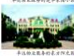
卓达物业服务的东方阳光园