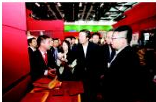
2013年10月23日至25日,第十二届中国国际绿色建筑博览会在北京举行。住房和城乡建设部部长李强在参观卓达新型材料展厅时表示,卓达新型材料代表了我国绿色建筑行业未来的发展趋势,符合国家产业战略政策,希望卓达新型材料不断技术创新,研发更多产品类型,不断满足国内并扩大国际绿色建筑市场需求,加强产销结合,进一步提高绿色建筑产业化水平,做全国绿色建筑产业的龙头。