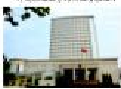
卓达物业服务的石家庄市政府