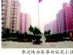
卓达物业服务的公司小区