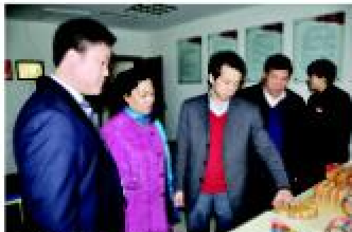
全国老龄委副主任朱建民(中)率调研组莅临卓达一行,参观考察卓达养老设施,实施了卓达社区养老服务模式的创新举措。