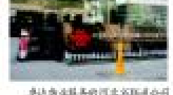
卓达物业服务的河北国际大酒店