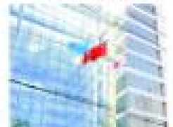
卓达物业服务的河北国际大酒店