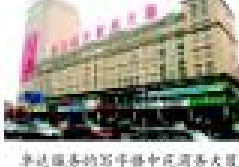
卓达物业服务的写字楼国际商务大厦