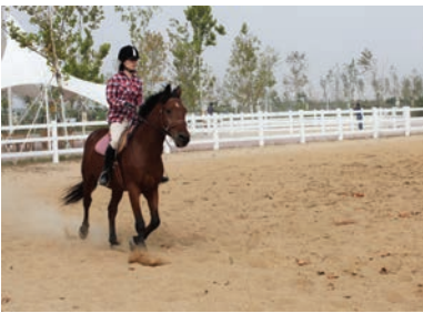
拥有纯正血统良马宝驹的卓达香水海马术俱乐部。