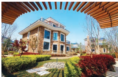
卓达香水海苏格兰城堡别墅。