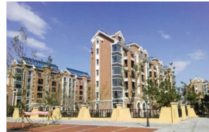
卓达香水海苏格兰城。