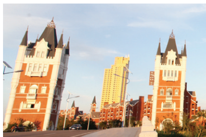
卓达香水海英伦湾。

卓达香水海以容纳世界的气度，将异域风情建筑组团从世界带回中国，蔚为大观的壮举，亦如一座世界博览园。那些圆顶角楼、多重人字形坡屋顶、淡黄色的墙、红色的瓦、深深的窗洞、孟沙式屋顶、精致的老虎窗、法式廊柱和雕花……各色建筑的大观园，丰盈呈现多种风情，世界特色建筑融汇一体，是建筑的博览园更是生活的天堂，人们居住于此，便仿佛于英伦、北欧等国外名城，享受异国高端品质生活。