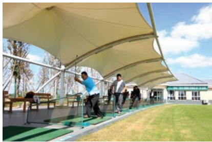
香水海城市中央公园内享受高贵运动人生。

卓达香水海同步世界高端配套，海洋公园、游艇、马术、城市中央公园等配套为业主精心打造一个真正意义的高端私属领地。在满足巅峰阶层顶级生活的同时，咫尺之遥的南海新区大学城，国内国家重点学府纷纷落址于此，如北京师范大学将在此建分校，北京交通大学威海校区已开始招生；此外香水海蒙特梭利幼儿园、香水海社区医院、商业街、老年中心等全方位社区服务，满足业主360°全方位生活所需。