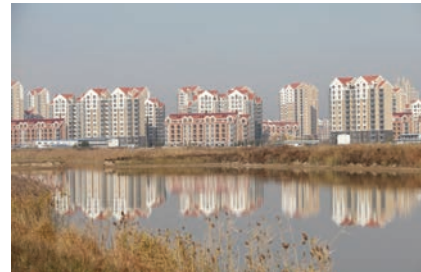
卓达香水海北欧小镇。