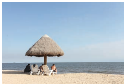
卓达香水海海洋公园沙滩娱乐区，人们沙滩嬉戏的天堂。