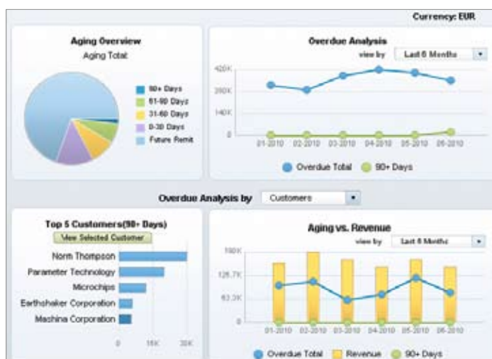
图 1: SAP® Business One 中的预构建财务过期仪表盘

此外，SAP Business One 不同于市场上其它大多数企业资源规划（ERP）应用，它提供可直接使用的预构建仪表盘。这样一来用户无需再开发仪表盘，从而降低了成本，加快了部署，且提高了用户满意度。